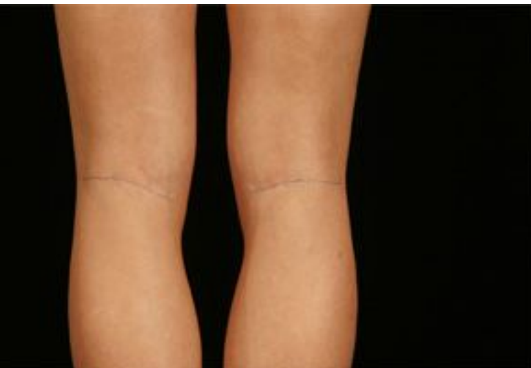
Vista posterior de l'articulació femorotibial (els plecs de la pell s'han marcat amb bolígraf perquè es vegi millor la línia articular de plegament)