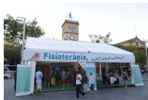
Col·legi de Fisioterapeutes de Catalunya La carpa divulgativa instal·lada aquesta setmana a Barcelona

Les opinions són dels internautes, no pas de lamalla.cat