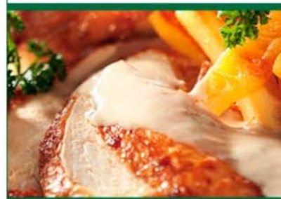
Pularda asada al cava con piña