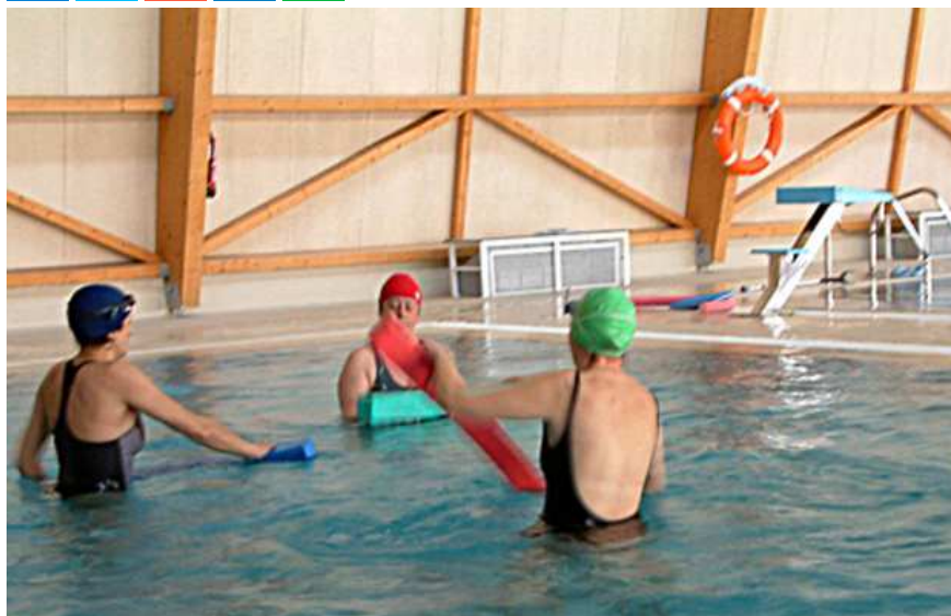
Cursos de gimnasia en el agua

El ejercicio físico terapéutico controlado por un profesional sanitario puede reducir los dolores osteoarticulares provocados por los problemas de espalda o la artrosis, entre otras causas, y que son muy frecuentes entre la población de más edad, según el Colegio Profesional de Fisioterapeutas de la Comunidad de Madrid (CPFCM) .