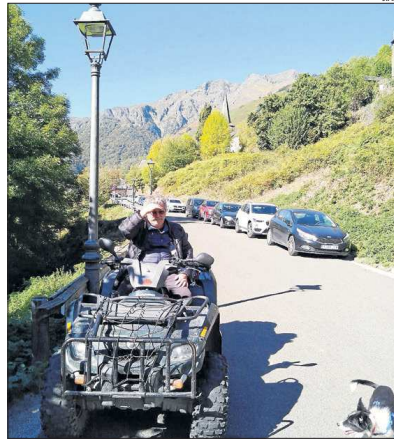
L'alcalde al seu quad dirigint la circulació.

encantat de Carlac i la tomba de Teresa, dos dels enclavaments més famosos del municipi. Barés va indicar que ahir al matí ja s'havien concentrat més d'una vintena de cotxes, dilluns en va comptabilitzar més de 120 i